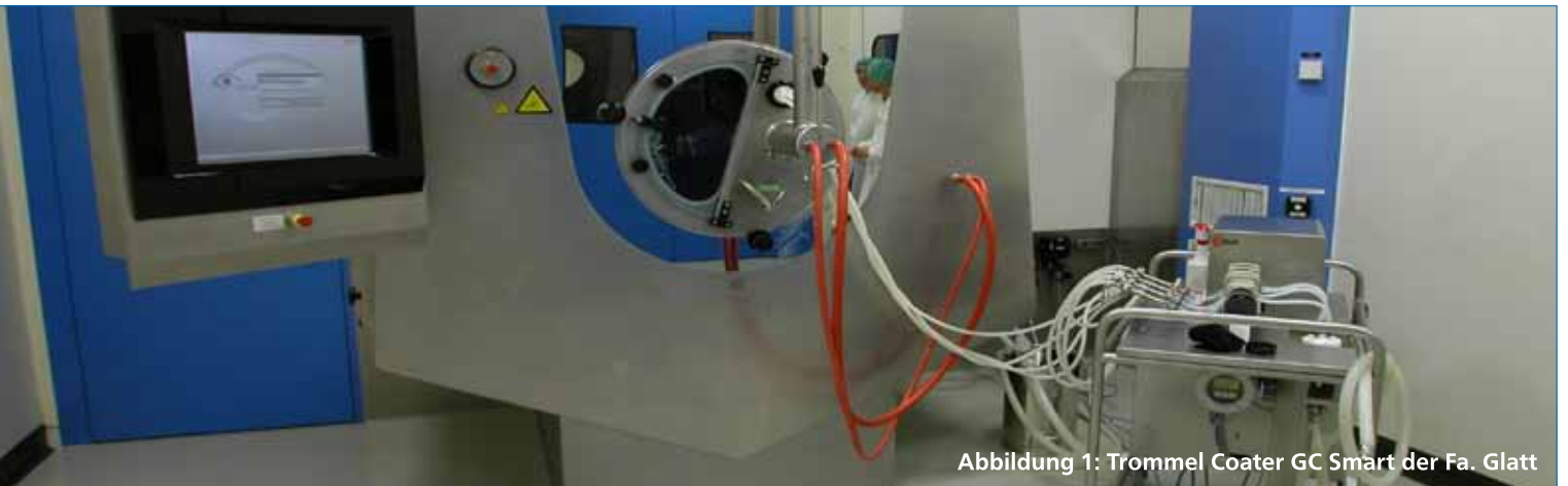
Abbildung 1: Trommel Coater GC Smart der Fa. Glatt

Durch hochqualifizierte Ingenieure und Techniker aus den unterschiedlichen Disziplinen (Verfahrenstechnik, Chemie oder Maschinenbau) mit jahrelangen Projekterfahrungen aus der pharmazeutischen Industrie, kann die weyer gruppe heute von der Planung über die Realisierung bis hin zur Inbetriebnahme und Qualifizierung das komplette Engineering im GMP-Umfeld abdecken. Mit dem Fokus auf die hohen regulatorischen Anforderungen in der pharmazeutischen Industrie legt die weyer gruppe bereits in der Planungsphase den Grundstein für eine erfolgreiche und wirtschaftliche Umsetzung der Kundenanforderungen sowie die Voraussetzung einer effektiven und konformen Durchführung der Qualifizierungs- und Validierungsaktivitäten gemäß den aktuellen Gesetzen und Richtlinien.